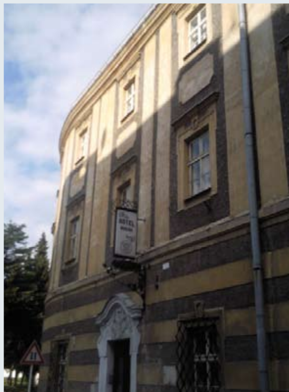
Průčelí krnovského kláštera