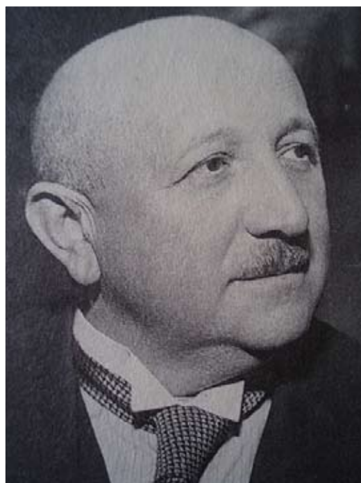
Rudolf Beran, předseda strany v letech 1935-38