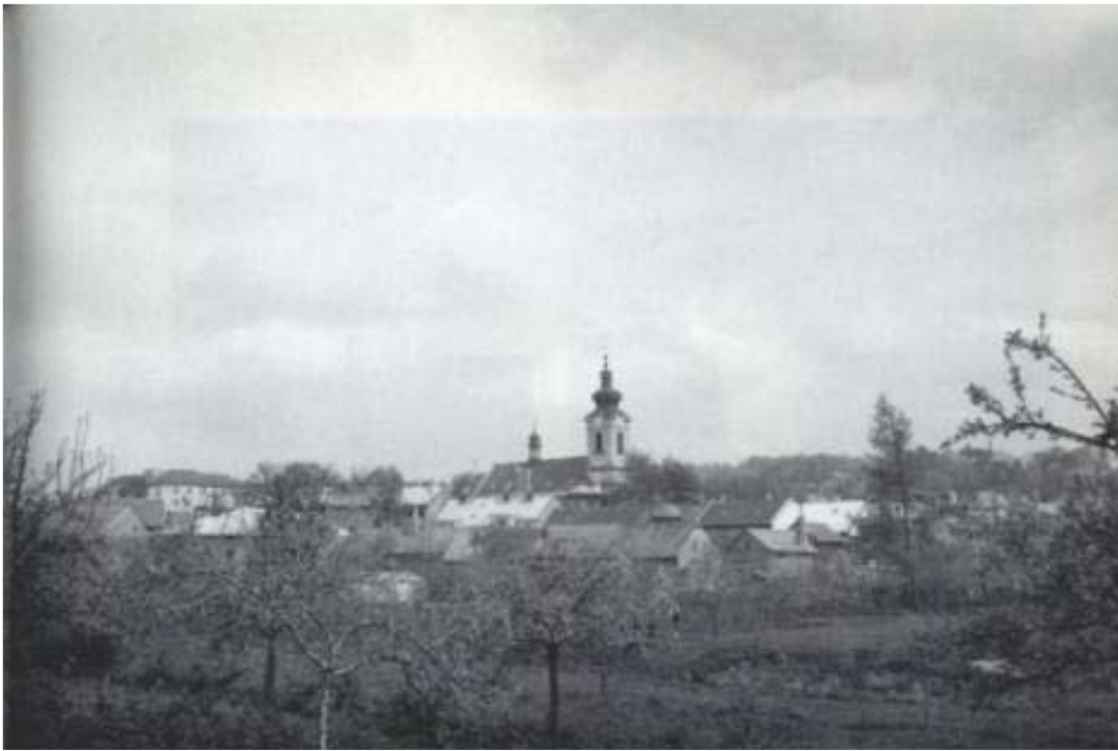
Tršice, rodiště paní Hradilové, na snímku z roku 1948